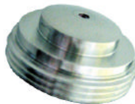
Deutsches Patent- u. Markenamt Patent Nr. 10 2005 025 583